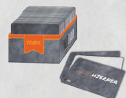
Kortholder og 250 stikordskort